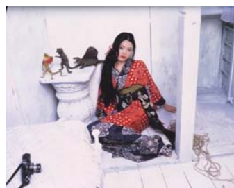
Nobuyoshi Araki A's Lovers, s.d., stampa a sviluppo cromogeno

Il ciclo di incontri si conclude con due visite guidate a complemento delle serate: